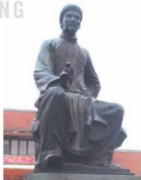
Tượng đại thi hào Nguyễn Du tại Khu lưu niệm Nguyễn Du ở huyện Nghi Xuân, tỉnh Hà Tĩnh