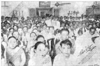
Rất đông người đến dự buổi diễn thuyết của Manh Manh nữ sĩ

Hình ảnh được sử dụng có thể gợi ấn tượng gì cho người đọc?