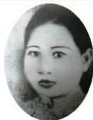
Manh Manh nữ sĩ

Nhận xét cách mở đầu văn bản của tác giả.