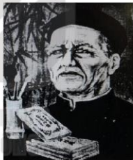
Nguyễn Đình Chiểu

Nguyễn Đình Chiểu (1822 – 1888) tự là Mạnh Trạch, hiệu là Trọng Phủ, quê gốc ở Thừa Thiên (nay là Thừa Thiên Huế). Nguyễn Đình Chiểu được sinh ở quê mẹ (phủ Tân Bình – tỉnh Gia Định – nay thuộc Thành phố Hồ Chí Minh). Hơn 10 tuổi, ông được cha đưa ra Huế ăn học, năm 21 tuổi (1843) thi đồ tú tài ở trường thi Gia Định, năm 27 tuổi (1849) ông ra Huế chuẩn bị thi tiếp thì được tin mẹ mất. Trên đường về lại Gia Định để chịu tang mẹ, phần vì khóc thương, phần vì ốm nặng nên ông bị mù cả hai mắt. Con đường khoa cử lỡ dở, ông sống bằng nghề dạy học và bốc thuốc.