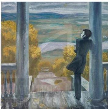
Mùa thu. Pu-skin

Gợi ý về một cách "đọc" đối với nét độc đáo của tác phẩm.