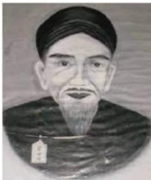
Nguyễn Công Trứ

Nguyễn Công Trứ là một tài năng lỗi lạc trong lịch sử Việt Nam thế kỉ XIX. Xuất thân là quan văn, nhưng ông đạt được nhiều thành tựu trong các lĩnh vực khác như quân sự, kinh tế, kiến trúc,... Ông có công lớn trong việc củng cố, phát triển vương triều Nguyễn, từng phụ trách việc đưa lưu dân đi khai khẩn lấn biển, mở rộng và lập ra một số huyện ở Ninh Bình, Nam Định, Thái Bình. Nguyễn Công Trứ có tâm hồn và tầm nhìn rộng lớn, ông nổi tiếng là nhà Nho thanh liêm, thương dân, yêu nước. Năm 1858, trước khi mất vì tuổi già sức yếu, biết tin thực dân Pháp nổ súng xâm lược nước ta, ông còn dâng sớ xin được cầm quân đánh giặc nhưng không được chấp thuận.